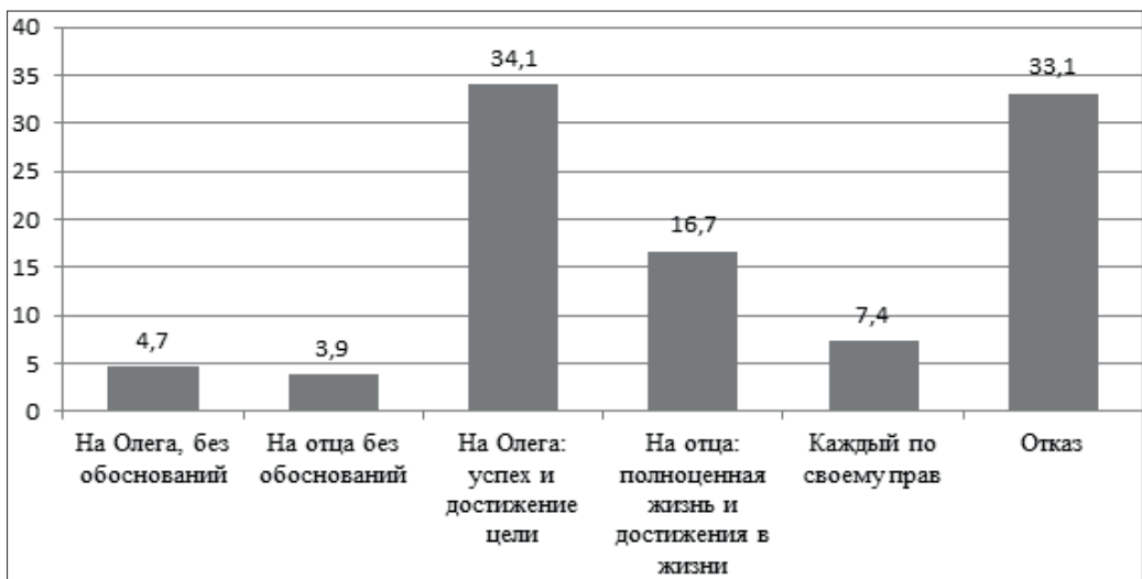
Рис. 1. Распределение ответов на вопрос «Чем ты похож на героев (отца и Олега) в этом фрагменте фильма?»

В ответах на вопрос «Чем ты похож на героев (отца и Олега) в этом фрагменте фильма?» большинство участников исследования считают, что они похожи на главного героя фрагмента фильма, — такие же целеустремленные (34,1 %). Важно отметить, что 33,1 % испытуемых сообщили, что не похожи на героев (рис. 1).