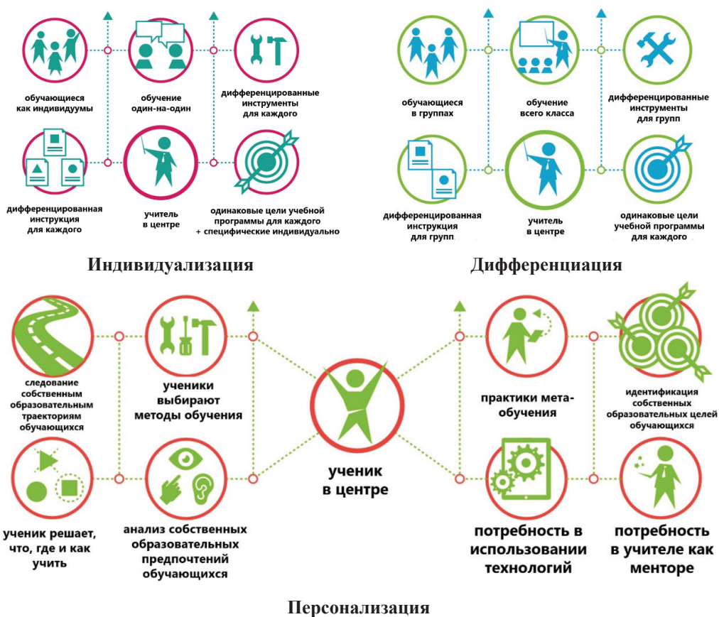
Рис. 1. Модели индивидуализации, дифференциации и персонализации обучения (по «The book of trends in education 2.0» [47])

Вторая бинарная оппозиция сложилась в зарубежной традиции, и именно с ее экспансией чаще всего приходится сталкиваться в частых дискуссиях. Это оппозиция форм образовательного процесса: персонализация vs индивидуализация и дифференциация. Наиболее ярко это противопоставление прозвучало с разницей в три года: сначала — в известной статье Б. Брей и К. Мак-Класки (B. Bray и K. McClaskey) 2012 года «Personalization vs Differentiation vs Individualization» (в 2018 году появилась ее третья версия) [46]; затем — в 2015 году в книге «The Book of Trends in Education 2.0» [47]. Наглядно различия между тремя понятиями визуализируются в сравнительных моделях (рис. 1), которые, несмотря на семантику, отличную от используемой в рамках первой обозначенной бинарной оппозиции, строятся на том же фундаменте — противопоставлении ученика как субъекта (персонализация) и ученика как объекта с шагом классификации второго уровня, где в качестве объекта работы учителя выступают либо группа обучающихся (дифференциация), либо отдельный ученик (индивидуализация).