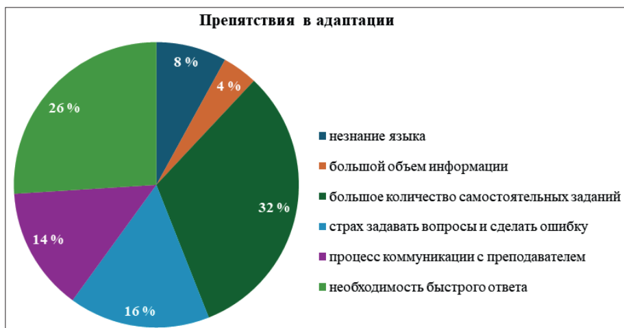
Рис. 1. Проблемные моменты, препятствующие успешной адаптации китайских студентов при обучении в российских вузах